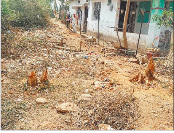
जंगल में कटे सागौन के पेड़।

वन अमले की लापरवाही से शहर से सटे महामाया पहाड़ के अस्तित्व पर बड़ा संकट उत्पन्न हो गया है। महामाया पहाड़ की सुरक्षा के उद्देश्य से वन विभाग ने पहाड़ी पर अवैध अतिक्रमण करने के साथ ही रेस्ट हाऊस सहित अन्य निर्माण किया है जहां नियमित विभाग के अधिकारी-कर्मचारियों की आवाजाही होती है साथ ही जंगल की सुरक्षा के लिए नियमित कर्मचारी भी नियुक्त हैं लेकिन वन अधिकारियों की लापरवाही से न तो पहाड़ी पर अवैध अतिक्रमण का सिलसिला रूक रहा है न ही सागौन पेड़ों की अवैध कटाई। दुर्भाग्य पहाड़ी के अलग-अलग हिस्से में दिनदहाड़े मरुमृदा का उत्खनन कर रहे हैं। धल्ले से चल रहे अवैध कटाई एवं उत्खनन पर लोग वन अधिकारियों पर भी मिलीभगत करने का आरोप