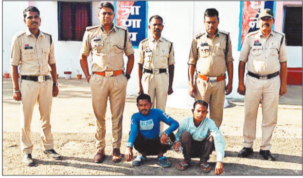
पुलिस गिरफ्त में हत्या का आरोपी।

थाना चरचा क्षेत्र में हुई एक सनसनीखेज हत्या का पुलिस ने खुलासा करते हुए मृतक के दोनो पुत्रों को गिरफ्तार कर लिया है। आरोपियों ने जमीन बेचने की बात से नाराज होकर अपने ही पिता की हत्या कर दी।