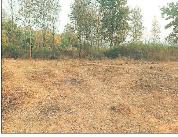
पेड़ों को काटकर बनाया गया मैदान।

लगा रहे हैं। पहाड़ी की वन भूमि पर अवैध अतिक्रमण कर सैकड़ों लोगों द्वारा पक्के मकान बनाने की शिकायत पर पिछले साल विभाग ने जांच उपरांत अतिक्रमणकारियों का चिन्हांकन किया था तथा अंतिम नोटिस जारी कर 19 जनवरी 2025 को पहाड़ी की वन भूमि पर बने 42 मकानों को ढहाकर अतिक्रमण हटाया था। विभाग ने पिछले साल जून में चोरकाकछार के 38 अवैध अतिक्रमण को हटा कर भूमि को कब्जा मुक्त किया था। वर्षों से वन भूमि में मकान बनाकर रह रहे लोगों को इस तरह की प्रशासनिक कार्रवाई की उम्मीद नहीं थी तथा लोग अंतिम समय तक इसका हल निकालने की उम्मीदें लगाए बैठे थे। विभाग ने वन भूमि में निवासरत अन्य अतिक्रमणकारियों का भी चिन्हांकन