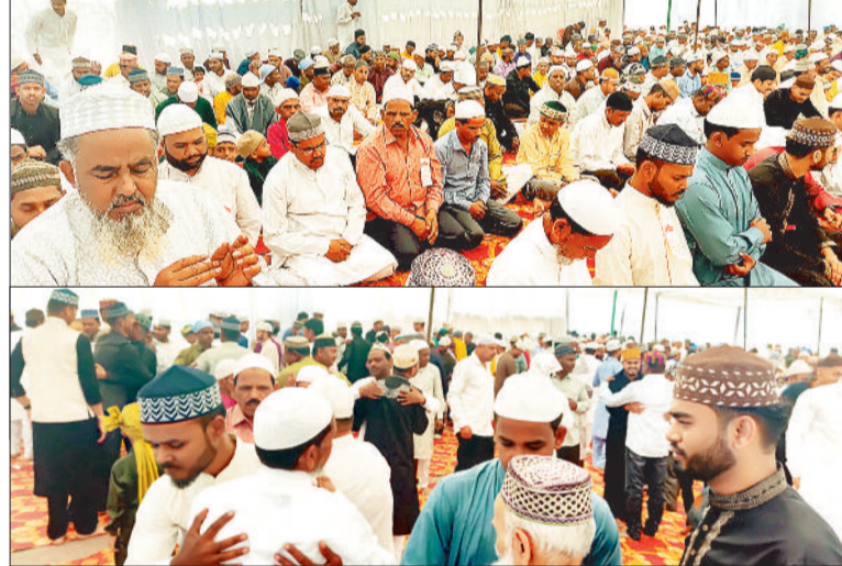
नमाज अदा करते समाज के लोग, गले मिलकर बधाई देते समाज के लोग।