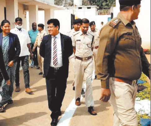
जेल का निरीक्षण करते अधिकारी।